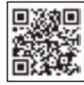
ユーザー登録用QRコード*