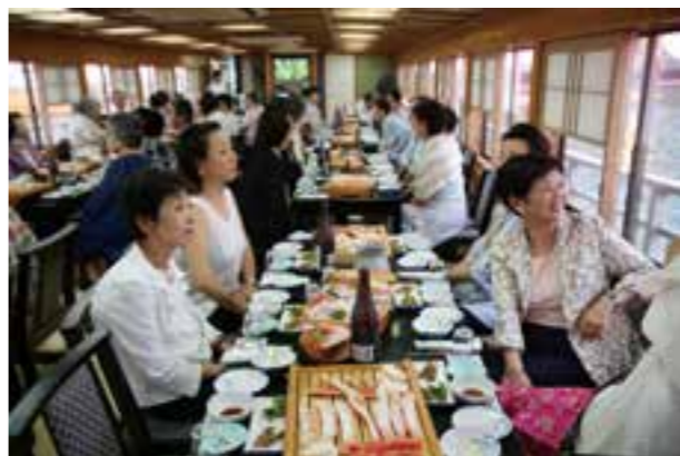
浦安で開催した千葉県女性会連合会事業(2018年)