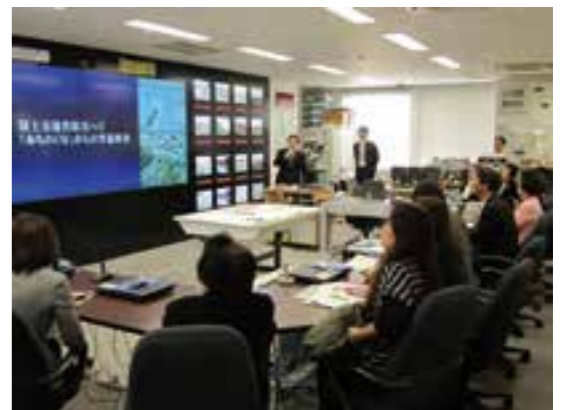
仙台商工会議所女性会訪問(2013年)