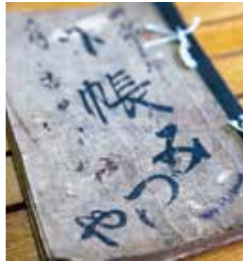
まだ「水屋」だったころの宿帳には、近代の小説家・菊地寛の名前が!