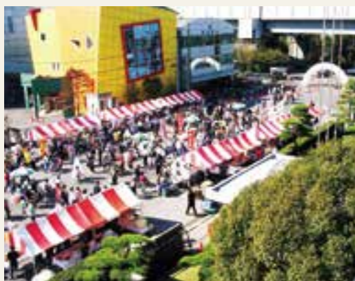
以前のゆ〜く〜カーニバルの様子

昨年で開催13回目を迎えた、「ゆ〜く〜カーニバル」もそんな思いで始めたもの。団地内を歩行者天国にして、ステージパフォーマンスや体験講座、