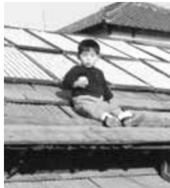
昔は長屋の屋根の上で生地を干していました。写真は幼き日の四代目