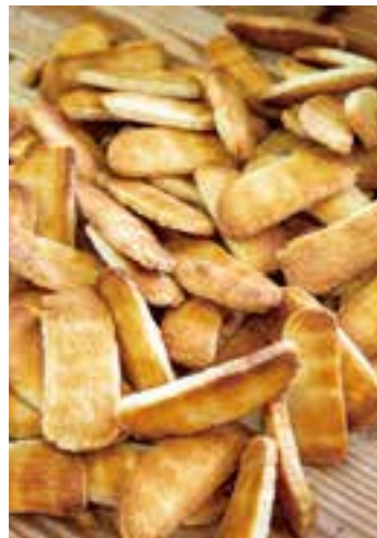
きつね色の焼き目が食欲をそそる、焼きたてのおかき

漁師町の面影が残る堀江3丁目。細い路地をくねくねと入っていったところにあるのが、浦安銘菓『美津屋のおかき』を作る『美津屋商店』さんです。